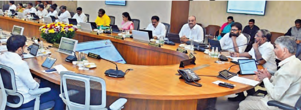
శుక్రవారం సీఎం చంద్రబాబు అధ్యక్షతన మంత్రి మండలి సమావేశ దృశ్యం

కేబినెట్ సమావేశంలో పలు కీలక నిర్ణయాలు ఫీజ్ రెగ్యులేటరీ కమిటీ ఏర్పాటు పైవేటు వల్లబీల చట్టంలో సవరణలు రూ.39వేల కోట్ల పెట్టుబడులకు ఆమోదం విశాఖపై ప్రత్యేక దృష్టి, ఐటీ, డేటా సెంటర్ల హబ్ అమరావతికి చట్టబద్ధతపై ప్రధాని మోడీ, కేంద్ర ప్రభుత్వానికి ధన్యవాదాలు